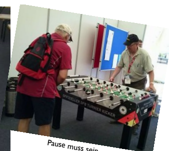
Pause muss sein...