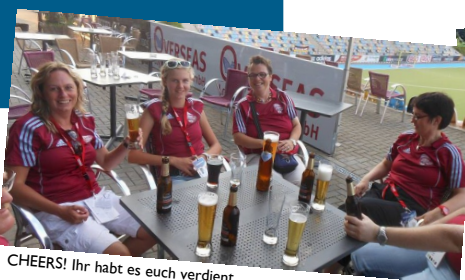
CHEERS! Ihr habt es euch verdient