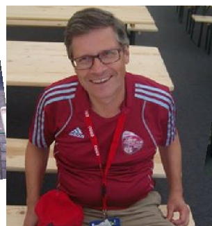
Kurze Verschnaufpause für Volo-Wolle